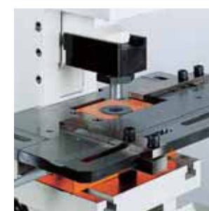
*Gruppo Punzonatrice Su Stozza.