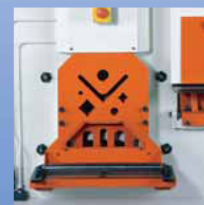
Prelamiera idraulico (opzionale su IW-45K)