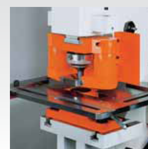
*Estrattore con molla in gomma