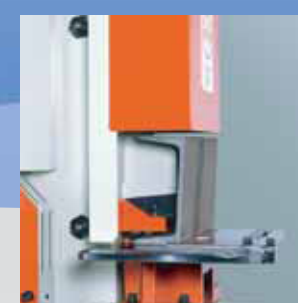
Stozzatura profilati su IW-85KD