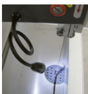
Ideale per macchine utensili

Lunghezza totale: 360 mm Base: magnetica Alimentazione: batteria Tubo flessibile: 250 mm Batterie: n°3 LR44 incluse