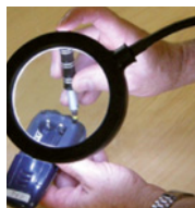
Ideale per lavori di precisione