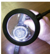
Luce LED antiriflesso

Diametro lente: 100 mm Base: magnetica Alimentazione: rete fissa - batteria Tubo flessibile: 250 mm Morsetto di bloccaggio: in dotazione