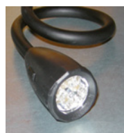
Luce a 3 LED