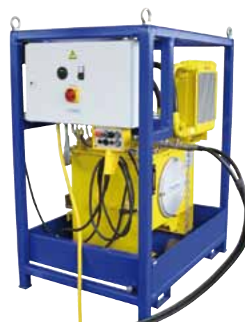
Centralina idraulica – vista posteriore