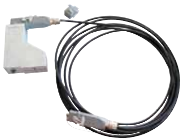
Unità di alimentazione con cavo