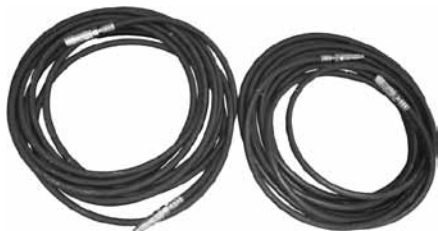
Set di tubi flessibili idraulici (15 m)