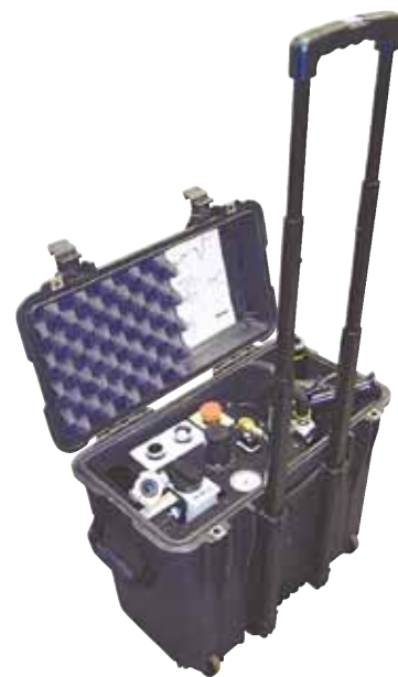
Modulo di controllo aria ACM