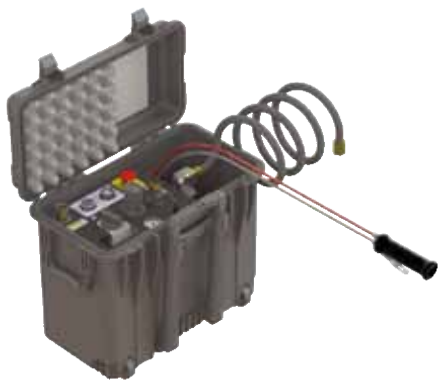
Gruppo filtro lubrificatore e controllo remoto in una robusta valigetta a tenuta stagna