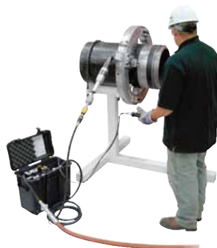
ACM per controllo Low Clearance Split Frame