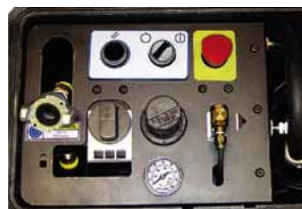
Ergonomico controllo con un semplice tocco delle dita per tutte le funzioni pneumatiche con pulsante di arresto di emergenza