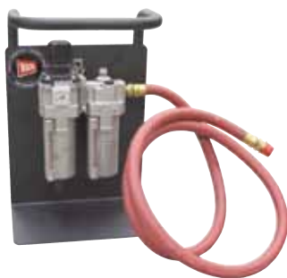
Gruppo filtro lubrificatore ATM