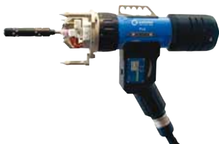
Teste per saldatura tubo piastra P16

A richiesta sono disponibili prolunghe vedere pag. 40.