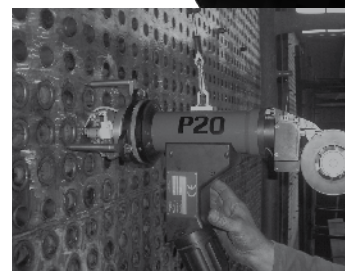
Maneggevole e versatile. Precisione di centraggio per mezzo di mandrini e cartucce intercambiabili.