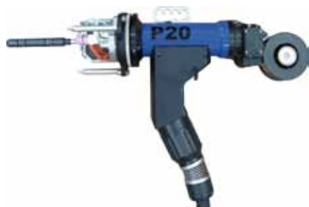
Testa di saldatura tubo piastra con filo freddo P20

A richiesta sono disponibili prolunghe vedere pag.40.