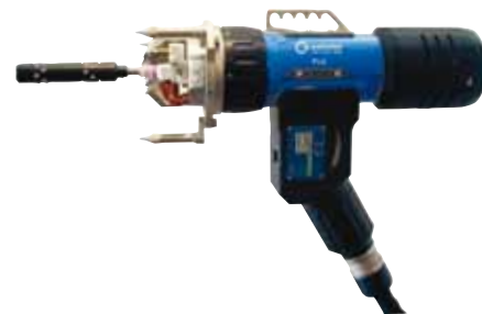
Testa di saldatura tubo piastra P16 AVC

Come la testa di saldatura P16, ma dotata di un controllo elettrico della tensione d'arco (AVC). Utilizzabile solo insieme al generatore ORBIMAT OM 300 CA AVC/OSC (vedere pag. 12).