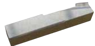
Adattatore utensile per lavorazione interna 4:1