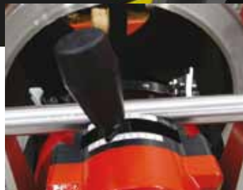
Regolazione angolo di smusso automatico.