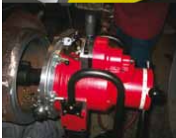
EP 424 in lavorazione.

Preparazioni perfette per OD DN 100 - 600 (4" - 24").