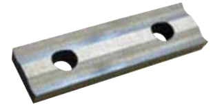
Inserto Premium HSS (2 taglienti)