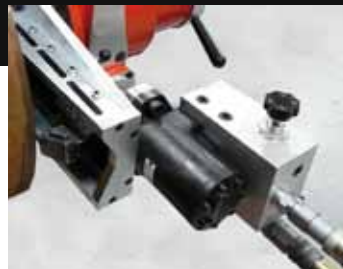
Motorizzazione idraulica, pneumatica o elettrica a richiesta.