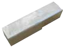
Inserito utensile HSS standard 9,5 x 9,5 mm