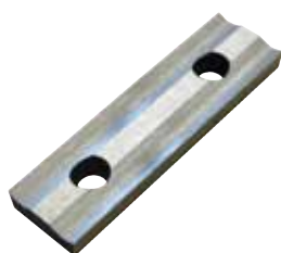
Inserto Premium HSS (2 taglienti)