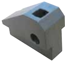
Portaplaquette per lavorazione interna a punto singolo