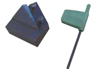
Kit portainseri utensili per smusso 37,5°