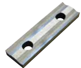
Inserto Premium HSS (2 taglienti)